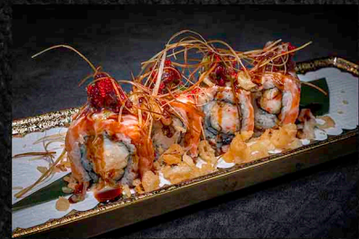
SPICY HOT LADY ROLL A|B|C|O

FRITTIERTE BLACK TIGER GARNELE | AAL | TOBIKO