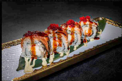
B|D SALMON LOVER ROLL