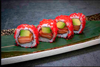
CLASSIC SALMON ROLL B