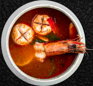
UNKAI TOM YUM C LEICHT-PIKANTE-SAUERE-SUPPE MIT GARNELE & GEMÜSE 8€