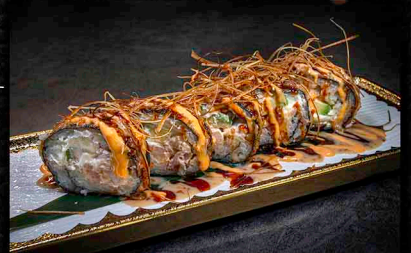
SPIDER ROLL C|B|O