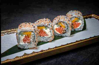
JUICY SALMON KISS ROLL B|D

KRABBFLEISCH (SURIMI) | AVOCADO | TOBIKO