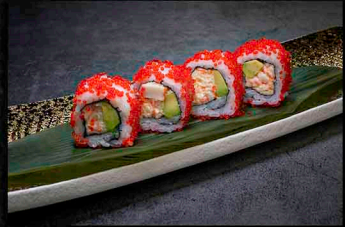
CALIFORNIA ROLL B|C