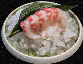
WOLFSBARSCH SASHIMI B 5 Scheiben 9€