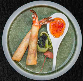
NOBASHI-STICK CIDJO KNUSPRIGE GARNELEN | KÄSE 6€