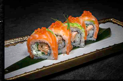
TRINITY SAUCE ROLL C|O

FRITTIERTE LACHSHAUT | CREME FRAICHE LACHS / AVOCADO