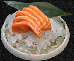
LACHS SASHIMI B 5 Scheiben 9€