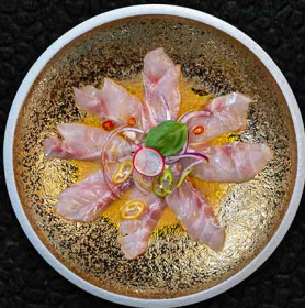
SANFTER LUBINA B WOLFSBARSCH | LIMETTE | TRÜFFELÖL 14€