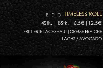
B|D|O TIMELESS ROLL

SCHARFER THUNFISCH | FRITTIERTE BLACK TIGER GARNELE | FLAMBIERTER LACHS