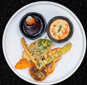
A1F1M10 YASAI TEMPURA FRITTIERTES GEMÜSE | WASABI-MAYO SOJA-SOBE MIT RETTICH 8€