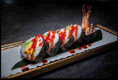
B|D|O FRIED SKY ROLL