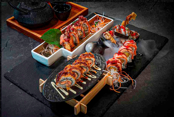
UNKAI UMAMI ROLLS A|B|C|D|F|O SPIDER ROLL 5 STK. | SALMON LOVER ROLL 4 STK. SPICY HOT LADY ROLL 4 STK. | CRUNCHY GOLD ROLL 4 STK. 32€