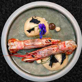
SAFRAN-WILDFANG-GARNELE C ARGENTINISCHE WILDFANG-GARNELE SAFRAN | KAFFIR 12€