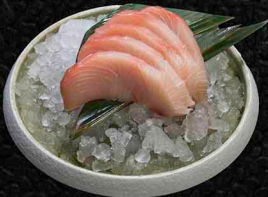
GELBFLOSSEN-MAKRELEN SASHIMI B 5 Scheiben 12€