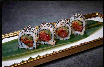
SPICY TUNA ROLL B|F