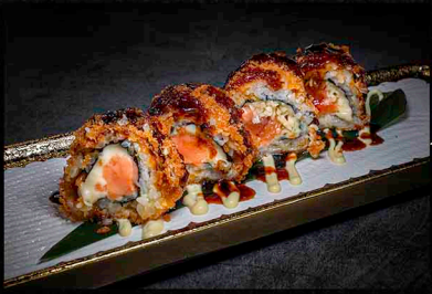
CRUNCHY GOLD ROLL A|B|D|O