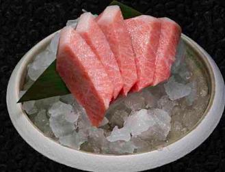
BLUEFIN THUNFISCH B CHUTORO 5 SCHEIBEN 18€ OTORO 5 SCHEIBEN 22€ *NUR WENN VERFÜGBAR