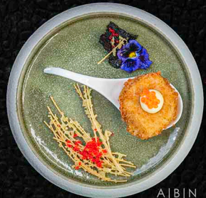
UMAMI JAKOBSMUSCHEL A|BIN JAKOBSMUSCHEL MIT MAYO UND FORELLENKAVIAR 7€