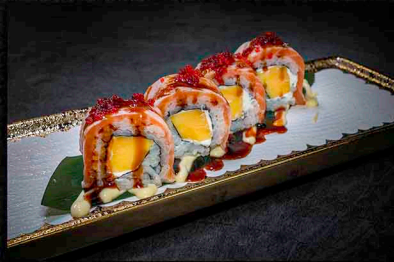
UNKAI DRAGON ROLL B|C|M|O

FLAMBIERTER LACHS | MANGO | CREME FRAICHE