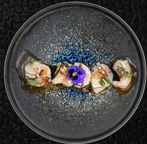
FLAUSCHIGE JAKOBSMUSCHEL N JAKOBSMUSCHEL CEVICHE-STYLE LIMETTE | INGWER-KORIANDER 14€