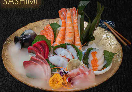
SASHIMI MORIAWASE B|N|C

JE 3 SCHEIBEN VOM LACHS | THUNFISCH | GELBFLOSSEN-MAKRELE WOLFSBARSCH | OKTOPUS | JAKOBSMUSCHEL 2 STÜCK BLACK TIGER GARNELE 32€