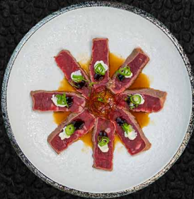
WER WILL BEEF D | G DRY AGED RIND | CREME FRAICHE | PONZU 17€