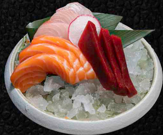
SASHIMI MIX B JE 3 SCHEIBEN VOM LACHS THUNFISCH | HAMACHI 17€

JE 3 SCHEIBEN VOM LACHS | THUNFISCH | GELBFLOSSEN-MAKRELE WOLFSBARSCH | OKTOPUS | JAKOBSMUSCHEL 2 STÜCK BLACK TIGER GARNELE 32€