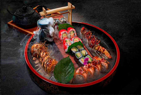
NINJA IN PYJAMA A|B|D|F|M|O SPICY HOT LADY ROLL 4 STK. | UNKAI DRAGON ROLL 4 STK. CALIFORNIA ROLL 4 STK. | SPICY TUNA ROLL 4 STK. | FRIED SKY ROLL 5 STK. AVOCADO MAKI 6 STK. 42€