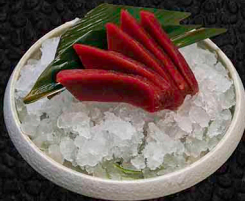
THUNFISCH SASHIMI B 5 Scheiben 12€