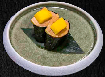
A10 FOIE GRAS GUNKAN GÄNSELEBER | MANGO 7€