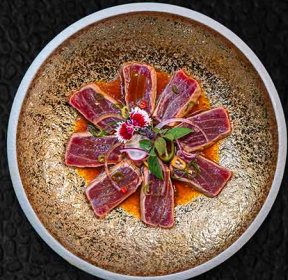
HEFTIGER THUNFISCH B THUNFISCH | TRÜFFELÖL | YUZU 17€