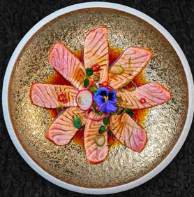
ELEGANTER LACHS B | G LACHS | PONZU | DASHI 14€