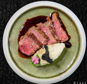
F1M10 MINI DRY AGED STEAK ROAST-BEEF | KOREANISCHE RÄUCHERSOBE 16€