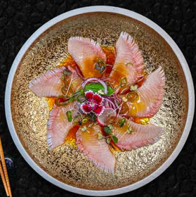
NOBLER HAMACHI B GELBFLOSSENMAKRELE | YUZU | TRÜFFELÖL 17€