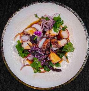
EDLER OKTOPUS MINIG OKTOPUS | PONZU | DASHI 18€