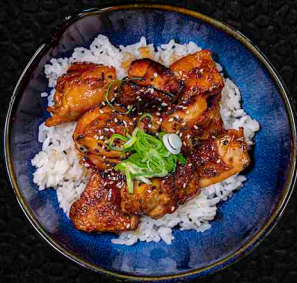
MINI CHICKEN TERIYAKI F1M10 HÄHNCHEN | TERIYAKI | REIS 12€